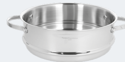
Vaporiera Ø 24 cm Steamer Ø 9 1/2"

EAN. 8056444040166 Cod. YM758Z1AFST Master 4 - Pallet 40