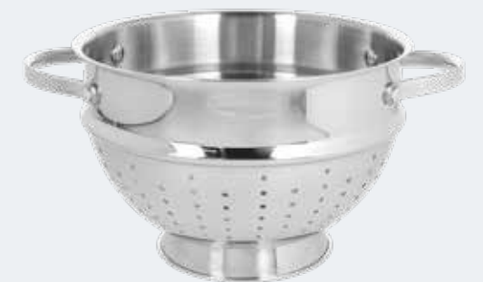
Scolapasta Ø 22 cm Colander Ø 8 7/8"

EAN. 8056444040180 Cod. YM758Z2AFST Master 4 - Pallet 32