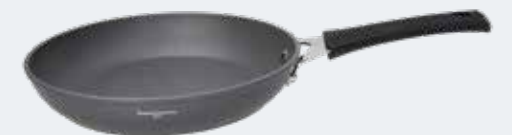
Padella 1 manico Ø 28 cm Frypan 1 handle Ø 11"

EAN. 8056444040296 Cod. YM758P6AFAL Master 4 - Pallet 72