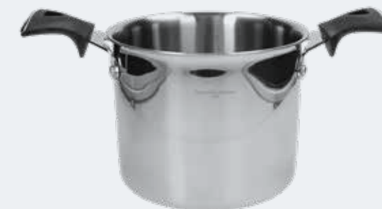
Pentola Ø 18 cm - 2,90 l High pot Ø 7 1/8" - 3,06 qt

EAN. 8056444040005 Cod. YM758PAAFST Master 4 - Pallet 48