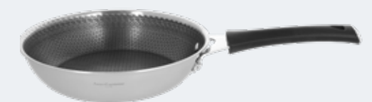
Padella 1 manico Ø 24 cm Frypan 1 handle Ø 9 1/2"

EAN. 8056444040043 Cod. YM758P4AFST Master 4 - Pallet 180