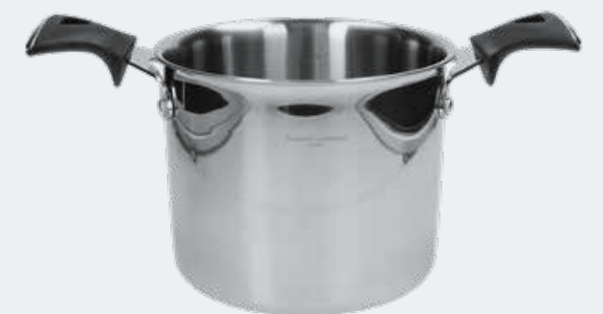
Pentola Ø 22 cm - 5,00 l High pot Ø 8 5/8" - 5,28 qt

EAN. 8056444040005 Cod. YM758PAAFST Master 4 - Pallet 48