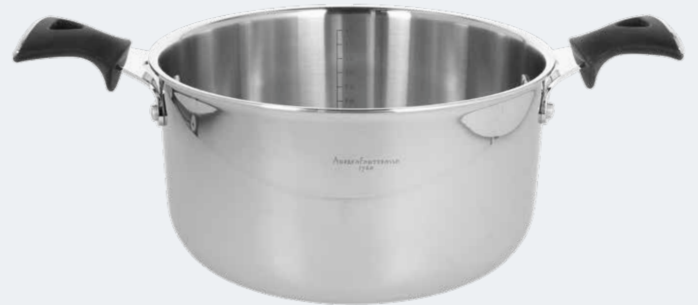
Casseruola 2 manici Ø 24 cm - 4,00 l Casserole 2 handles Ø 9½" - 4,22 qt

EAN. 8056444039986 Cod. YM7581EAFST Master 4 - Pallet 64