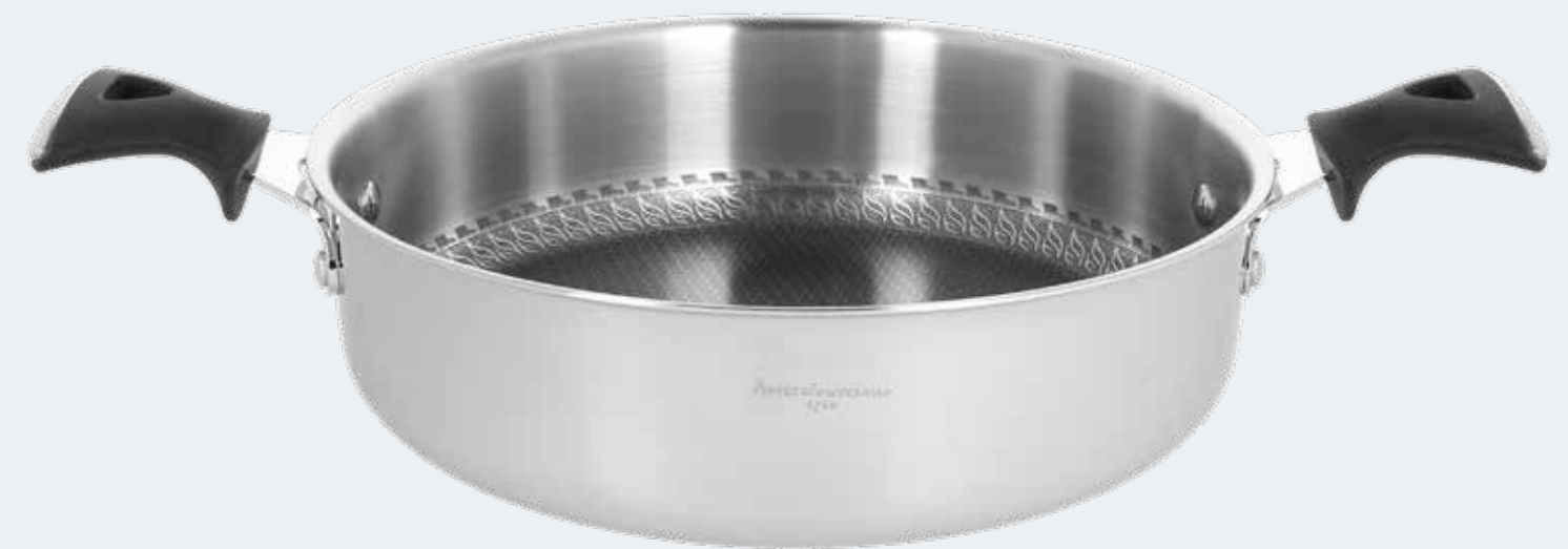
Tegame 2 manici Ø 28 cm - 3,50 l Skillet 2 handles Ø 11" - 3,70 qt

EAN. 8056444040234 Cod. YM75838AFST Master 4 - Pallet 48