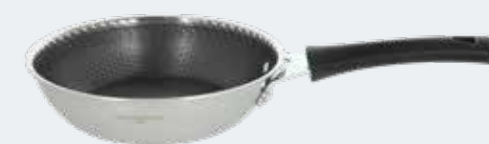
Padella 1 manico Ø 20 cm Frypan 1 handle 7 7/8"

EAN. 8056444040081 Cod. YM758P8AFST Master 4 - Pallet 60