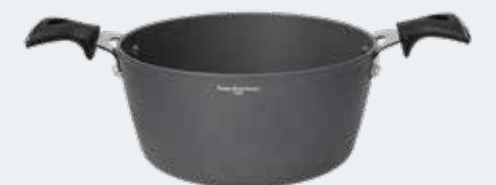
Casseruola 2 manici Ø 20 cm - 2,40 l Casserole 2 handles Ø 7¾" - 2,54 qt

EAN. 8056444040920 Cod. YM7581BAFAL Master 4 - Pallet 144