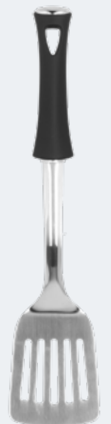
Spatola acciaio inox Stainless steel turner EAN. 8056444043273 Cod. YM4AJ63AFUT Inner 6 - Master 72 - Pallet 864