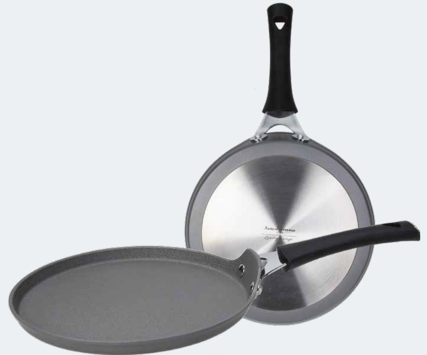
Crepiera Ø 25 cm Crepe pan Ø 9 7/8"

EAN. 8056444040845 Cod. YM758CQAFAL Master 4 - Pallet 108