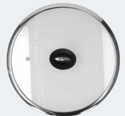
Coperchio in vetro trasparente con bordo in acciaio Ø 28 cm Flat glass lid with steam vent and steel rim Ø 11"

EAN. 8056444041767 Cod. YM558C6AFLD Master 4 - Pallet 160