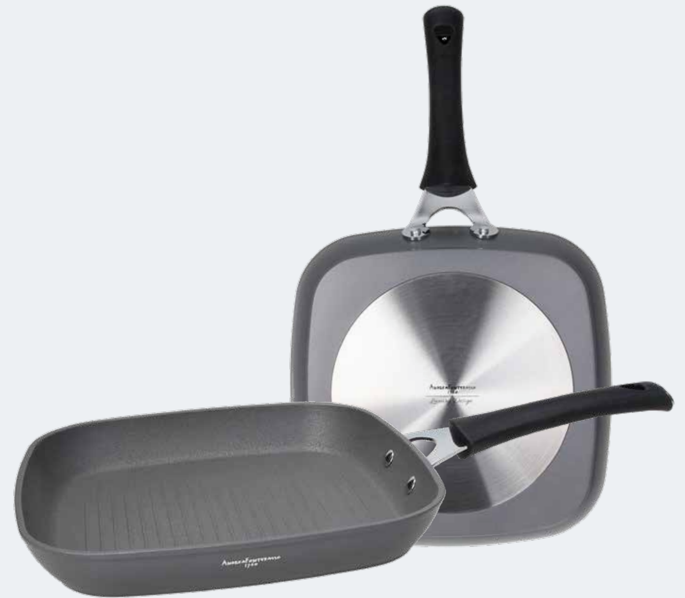
Grill quadra 28x28 cm Square grill 11"x11"

EAN. 8056444040869 Cod. YM758BLAFAL Master 4 - Pallet 72