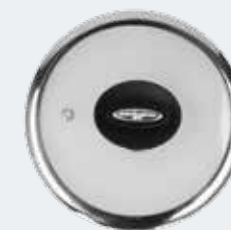
Coperchio in vetro trasparente con bordo in acciaio Ø 16 cm Flat glass lid with steam vent and steel rim Ø 6¼"

EAN. 8056444041248 Cod. YM558C2AFLD Master 4 - Pallet 320