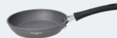
Padella 1 manico Ø 20 cm Frypan 1 handle 7¾"

EAN. 8056444040364 Cod. YM758P1AFAL Master 4 - Pallet 48