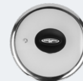
Coperchio in vetro trasparente con bordo in acciaio Ø 18 cm Flat glass lid with steam vent and steel rim Ø 7½"

EAN. 8056444041248 Cod. YM558C2AFLD Master 4 - Pallet 320