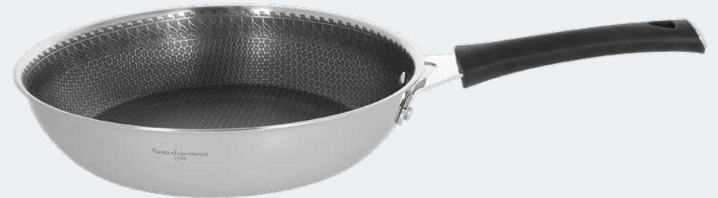
Padella 1 manico Ø 28 cm Frypan 1 handle Ø 11"

EAN. 8056444040081 Cod. YM758P8AFST Master 4 - Pallet 60