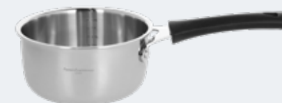
Casseruola 1 manico Ø 16 cm - 1,30 l Saucepan 2 handles Ø 6¼" - 1,37 qt

EAN. 8056444039986 Cod. YM7581EAFST Master 4 - Pallet 64