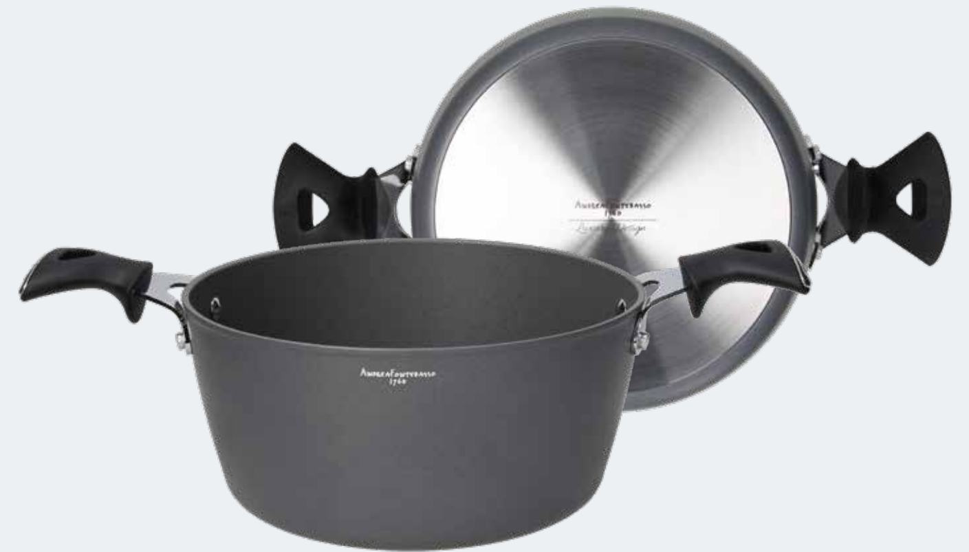
Casseruola 2 manici Ø 24 cm - 4,00 l Casserole 2 handles Ø 9½" - 4,22 qt

EAN. 8056444040982 Cod. YM7581EAFAL Master 4 - Pallet 64