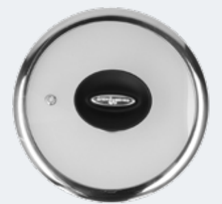
Coperchio in vetro trasparente con bordo in acciaio Ø 20 cm Flat glass lid with steam vent and steel rim Ø 7¾"

EAN. 8056444041347 Cod. YM558C3AFLD Master 4 - Pallet 208