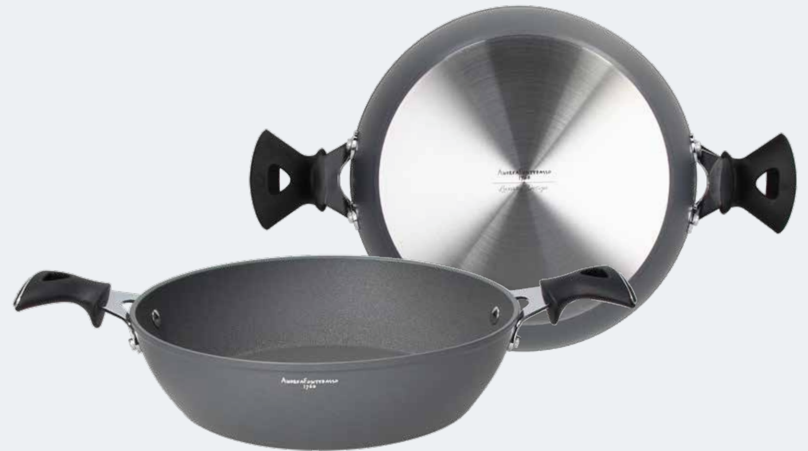
Tegame 2 manici Ø 28 cm - 3,50 l Skillet 2 handles Ø 11" - 3,70 qt

EAN. 8056444040425 Cod. YM75838AFAL Master 4 - Pallet 48