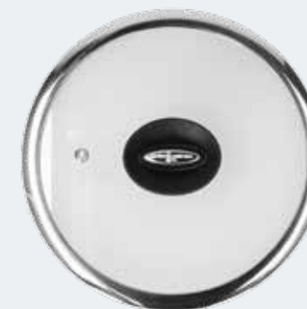
Coperchio in vetro trasparente con bordo in acciaio Ø 22 cm Flat glass lid with steam vent and steel rim Ø 8"

EAN. 8056444041446 Cod. YM558C4AFLD Master 4 - Pallet 208