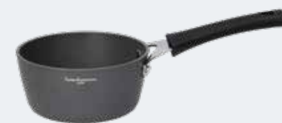
Casseruola 1 manico Ø 16 cm - 1,30 l Saucepan 1 handle Ø 6¼" - 1,37 qt

EAN. 8056444040982 Cod. YM7581EAFAL Master 4 - Pallet 64