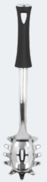
Servispaghetti acciaio inox Stainless steel spaghetti server EAN. 8056444043242 Cod. YM4AJ64AFUT Inner 6 - Master 72 - Pallet 864