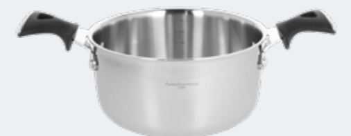
Casseruola 2 manici Ø 20 cm - 2,40 l Casserole 2 handles Ø 7¾" - 2,54 qt

EAN. 8056444039948 Cod. YM7581BAFST Master 4 - Pallet 144