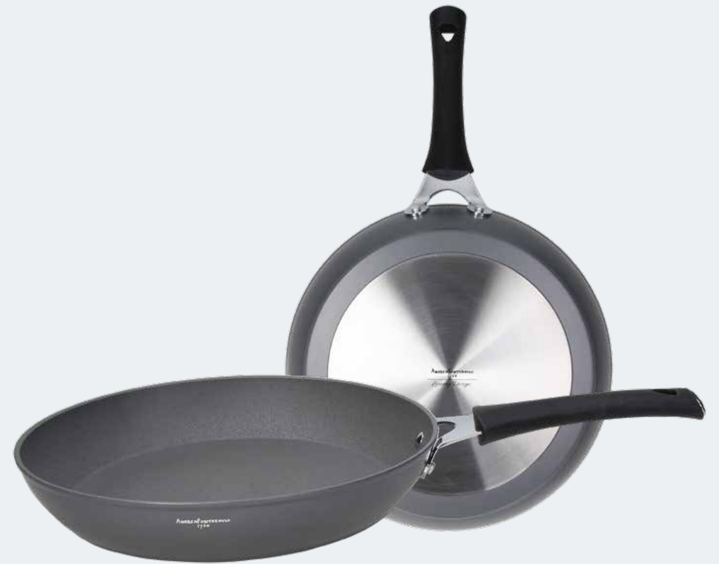
Padella 1 manico Ø 32 cm Frypan 1 handle Ø 12½"

EAN. 8056444040364 Cod. YM758P1AFAL Master 4 - Pallet 48