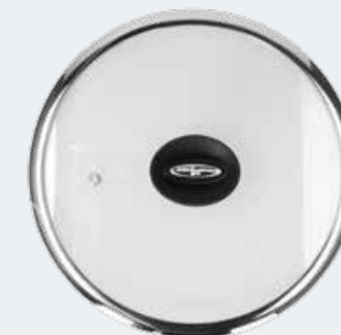
Coperchio in vetro trasparente con bordo in acciaio Ø 24 cm Flat glass lid with steam vent and steel rim Ø 9½"

EAN. 8056444041507 Cod. YM558C5AFLD Master 4 - Pallet 160