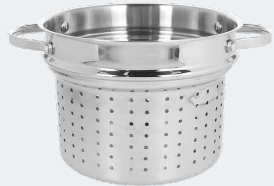
Cuocispaghetti Ø 22 cm - 5,60 l Spaghetti cooker Ø 8 7/8" - 5,92 qt

EAN. 8056444040166 Cod. YM758Z1AFST Master 4 - Pallet 40