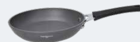
Padella 1 manico Ø 24 cm Frypan 1 handle Ø 9½"

EAN. 8056444040258 Cod. YM758P4AFAL Master 4 - Pallet 180